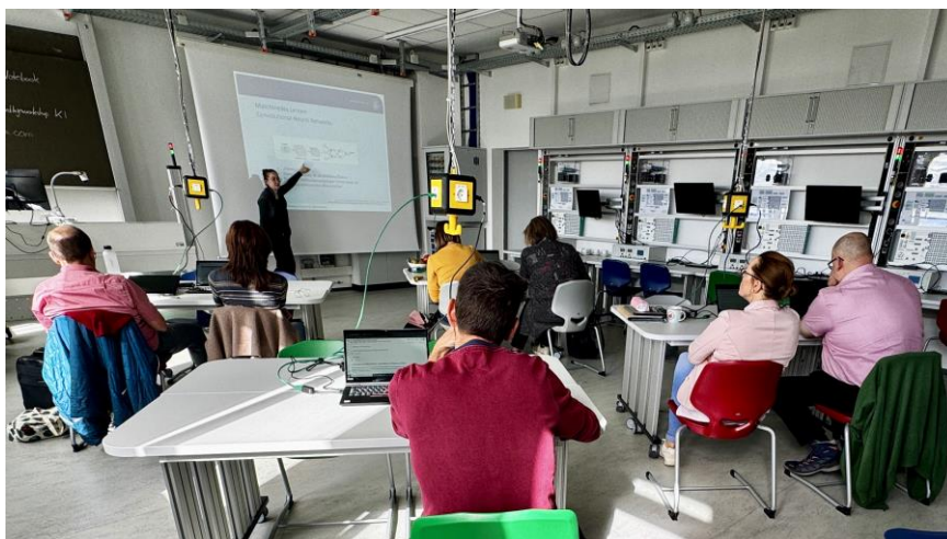
Impression aus dem Grundlagenworkshop Künstliche Intelligenz

Ein Workshop über Künstliche Intelligenz vermittelte theoretische und praktische Einblicke, einschließlich des Maschinellen Lernens.