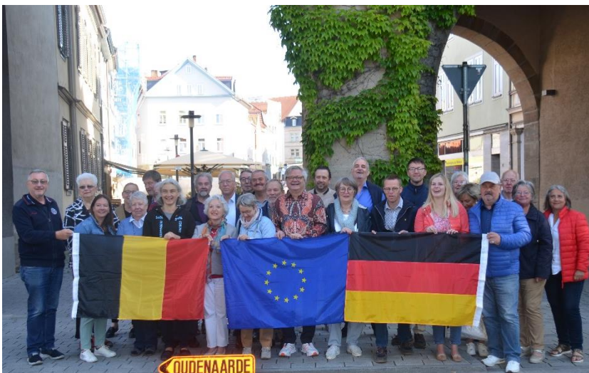
Verabschiedung vor dem Ketschentor