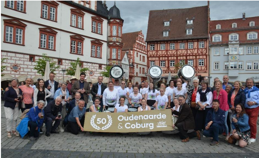
Empfang auf dem Marktplatz