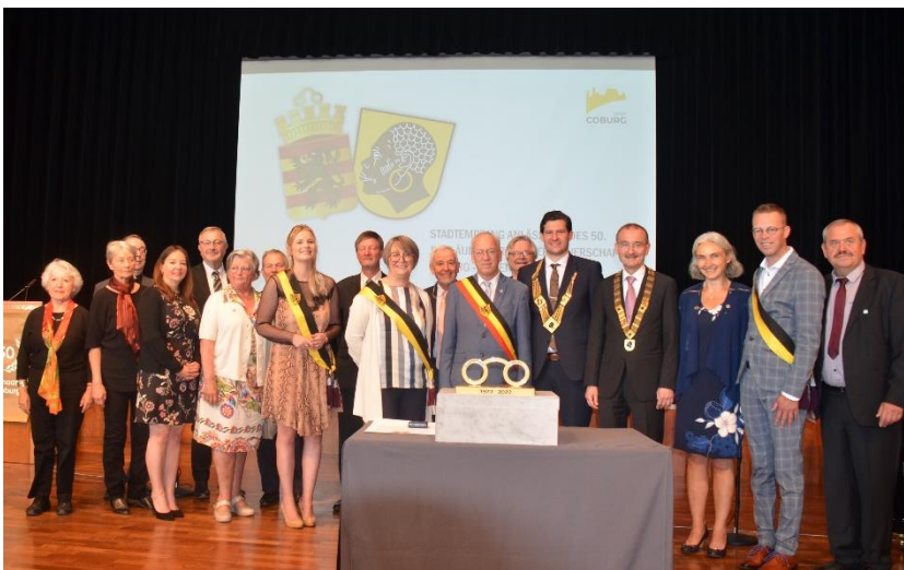
Stadtempfang im Kongresshaus Rosengarten